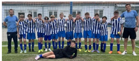
Mladší žáci oddílu fotbalu po vítězném utkání v Rajhradě