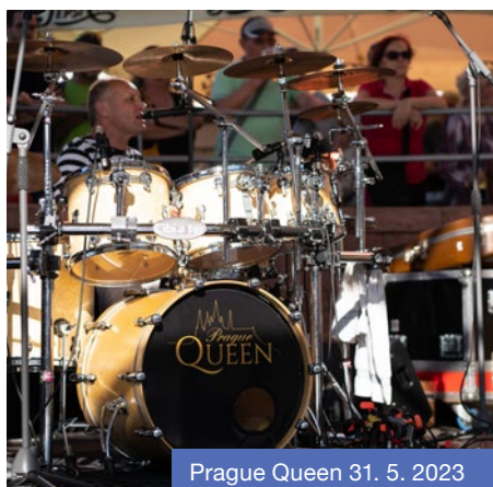
Prague Queen 31. 5. 2023