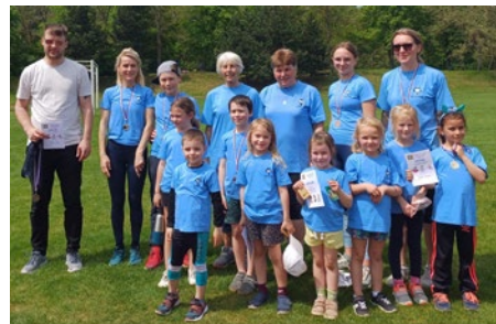
Oddíl ČASPV na atletických závodech v Brně - Bystrci