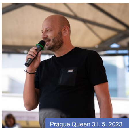
Prague Queen 31. 5. 2023