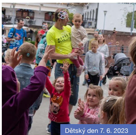
Dětský den 7. 6. 2023