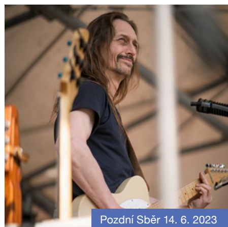
Pozdní Sběr 14. 6. 2023