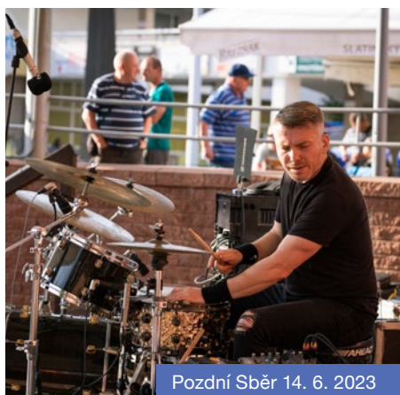
Pozdní Sběr 14. 6. 2023