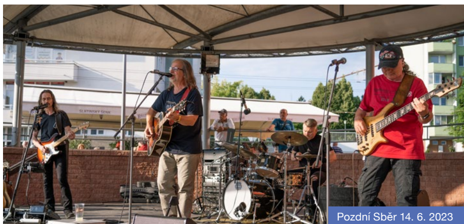
Pozdní Sběr 14. 6. 2023