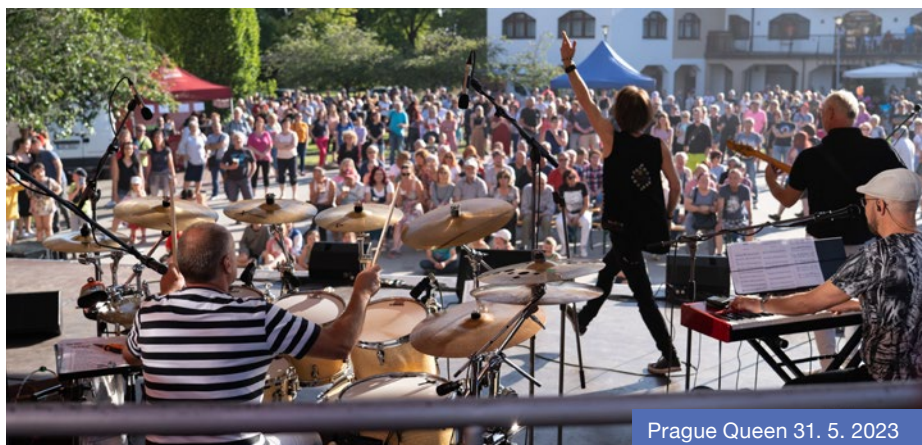
Prague Queen 31. 5. 2023