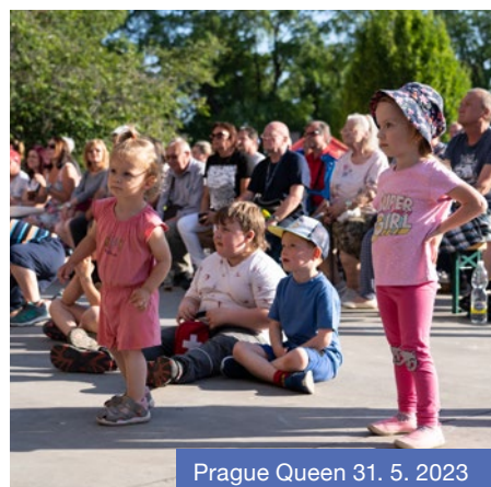
Prague Queen 31. 5. 2023