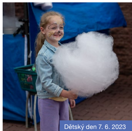
Dětský den 7. 6. 2023