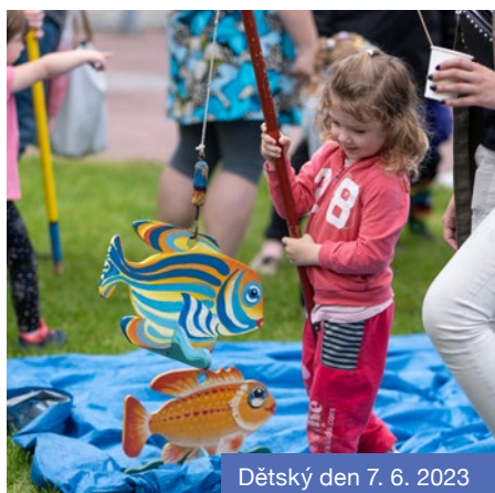
Dětský den 7. 6. 2023